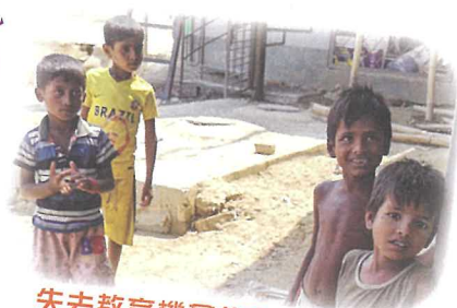
失去教育機會的孟加拉街童