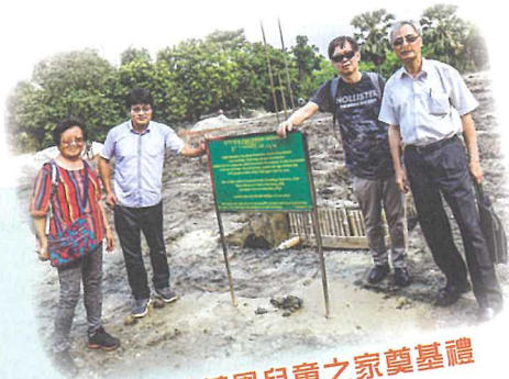
孟加拉華恩兒童之家奠基禮